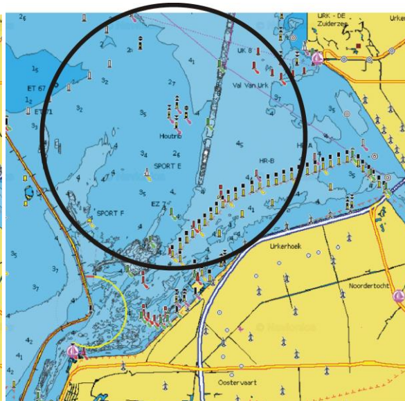
wedstijdgebied Familiecruiser en 30 mijls